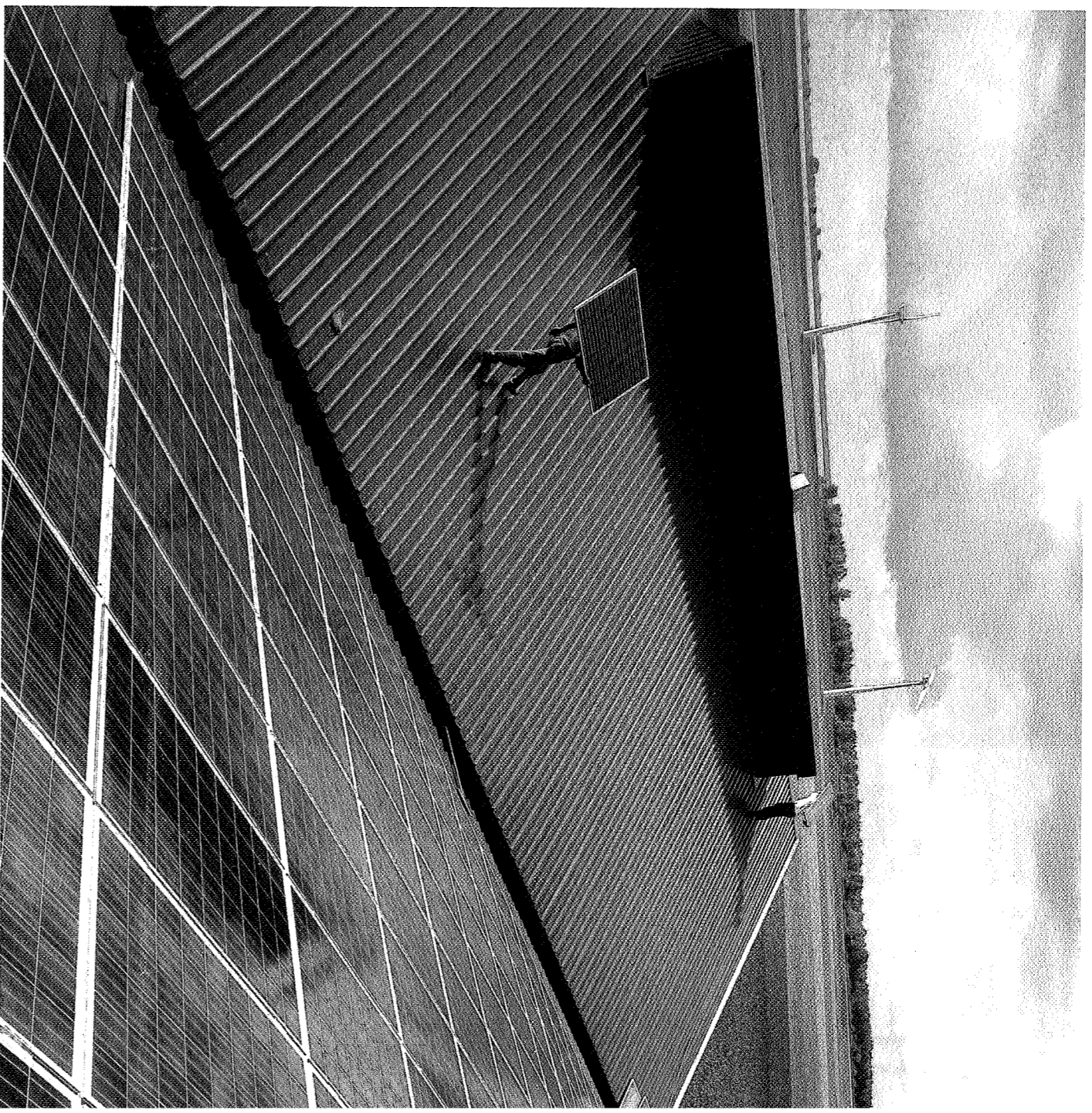
Er komt steun voor luchtwassers, mestverwerking en zonnepanelen.

De toeslagen, die onderdeel zijn van de eerste pijler van het GLB, zijn in Nederland nog gebaseerd op historische productie. Dat gaat veranderen. In het landbouwbeleid van 2014 tot 2020 wil de Europese Commissie dat boeren in de verschillende lidstaten eenzelfde bedrag per hectare krijgen.