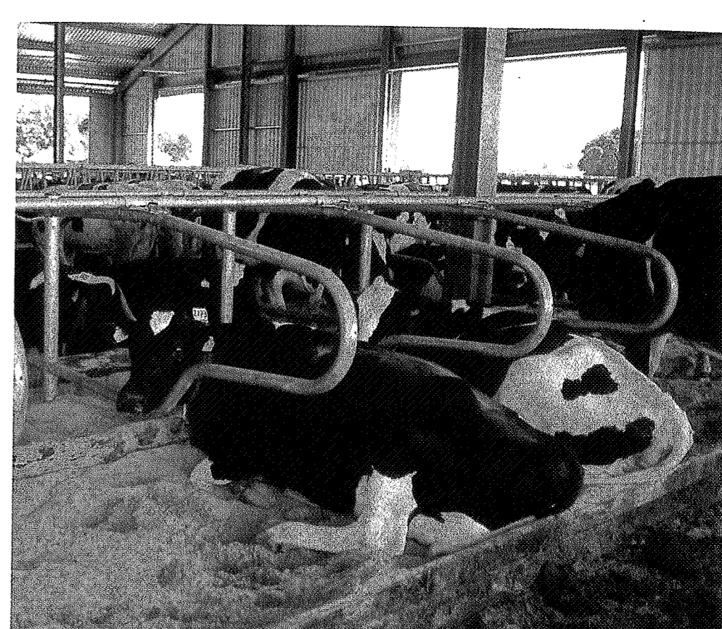
Zandboxen bieden veel comfort, en grip bij het opstaan. Dit systeem is alleen mogelijk in combinatie met een dichte vloer met mestschuif. Sneller slijten van de schuif geldt als een groot nadeel.

ER VERRIJZEN VEEL NIEUWE STALLEN. BIJ HET KIEZEN VAN DE BOXINRICHTING SPEELT KOECOMFORT EEN GROTE ROL. ALLE VOOR- EN NADELEN VAN DE SYSTEMEN OP EEN RIJ.